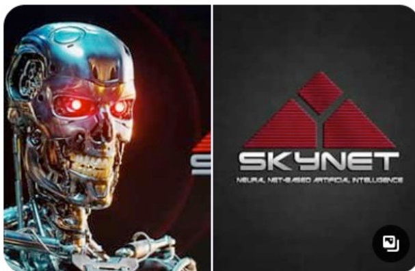
Skynet (Terminator) - Wikipedia

Die Leute, die es geschrieben haben, wurden gezwungen, es zu schreiben und sich etwas einfallen zu lassen, was nicht Kim ist. So wurde es ihnen gesagt. Das haben sie getan, und sie wissen, dass es wahrscheinlich zum Absturz kommen wird, wenn sie einen Haken daran machen, und das wird es auch. Ich habe eine Analyse gemacht, nachdem sie das Papier veröffentlicht hatten, und wenn sie alles miteinander verbinden, wird das System schätzungsweise 2 Minuten und 56 Sekunden durchhalten. Aber hey, sie haben sich etwas einfallen lassen. Der Plan basiert auf dem Erfolg eines Unternehmens namens Skynet . In Phase 2 soll es mit dem Skynet-Programm verbunden werden und dann mit der Implementierung des Social Crediting-Systems beginnen, für das kein Kapazität hat. Es bleibt ein Traum. Sie own nothing and like der Barcode of Life die wir kürzlich gegeneinander unter euch, die wahrscheinlich zum Terminator-Film von