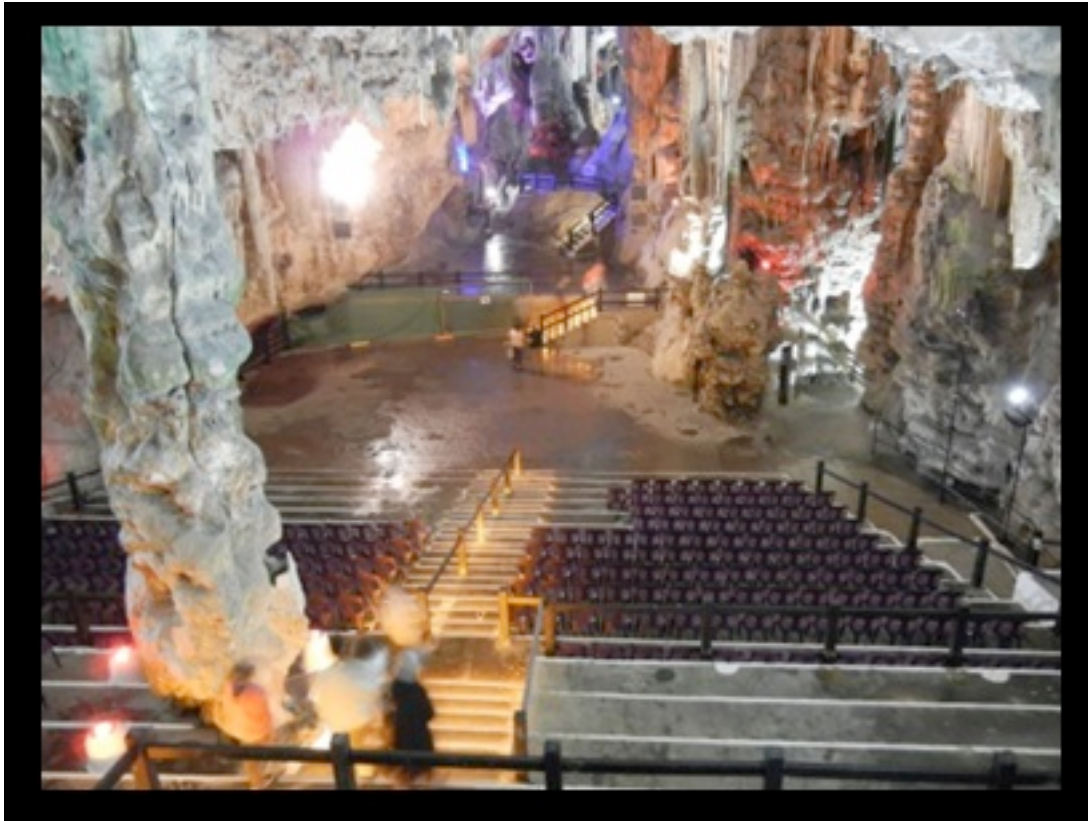
St. Michael's Cave in Gibraltar