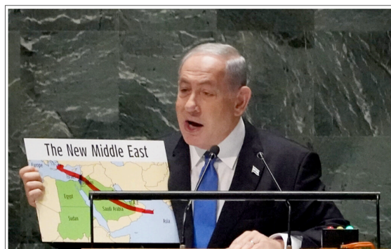
Prime Minister Benjamin Netanyahu uses a red marker on a map of 'The New Middle East' as he addresses the 78th session of the United Nations General Assembly, Friday, Sept. 22, 2023. The following is the full text of Prime Minister Benjamin Netanyahu's address to the UN General Assembly on September 22, 2023, as released by the Prime Minister's Office.

Gehen wir noch einen Schritt weiter: Das ist auch der Grund, warum das Militär und die Geheimdienste direkt an diese Familien berichtet haben. Das war auch der Beginn des Abkommens mit der Schwarzen Sonne über die Sicherheit der Planetarischen Tore. Das erste Tor bzw. die erste Säule bezüglich eines der grossen Aufzüge auf der Erde, die ganz nach unten führen, befand sich in Israel, unter Tel Aviv, weshalb das Gatekeeper-Programm dort eingerichtet wurde. Dies ist auch der Grund für den Gross-Israel-Plan, der gestern Abend erneuert werden sollte. Der Plan, von dem Netanjahu in seiner Rede vor der UN-Vollversammlung gesprochen hat, sieht eine Ausdehnung Israels auf den gesamten Nahen Osten und den Krieg vor, den ihr jetzt dort erlebt.