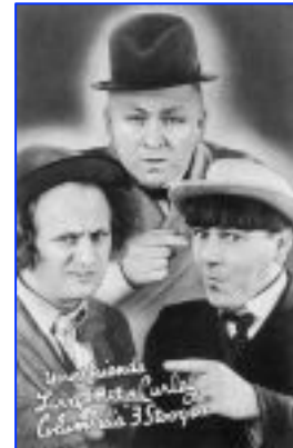
Die 3 Witzbolde

Sie versuchen, den Dritten Weltkrieg auszulösen, aber „Zu Ihrem Unglück,“ formuliert Kim, „versuchen Moe Rothschild, Larry Rothschild und Curly Rothschild, eine Operation durchzuführen, und sie scheitern kläglich! Da ist kein Geld vorhanden!“