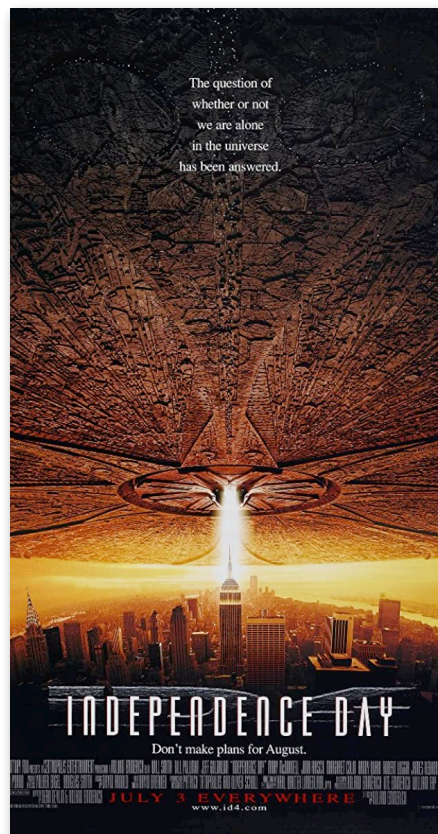
Independence Day (Film 1996)

Für die meisten Amerikaner ist der 4. Juli der Tag, an dem die Unabhängigkeitserklärung unterschrieben wurde. Es gab schon viele Filme über den Unabhängigkeitstag. Besonders bekannt ist der Film aus dem Jahr 1996, in dem es am Unabhängigkeitstag eine Alien-Invasion gab. Dafür gibt es einen eindeutigen Grund. Historisch gesehen wurde die Unabhängigkeitserklärung an diesem Tag unterzeichnet, weil es ein Zeitpunkt war, an dem die niederen Astralwesen auf den Planeten kommen würden. Das sollte heute sein.